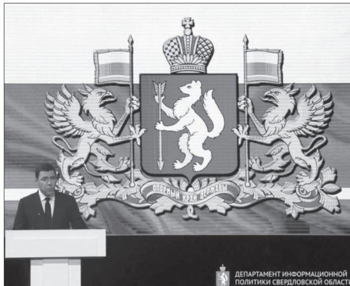
ДЕПАРТАМЕНТ ИНФОРМАЦИОННОЙ ПОЛИТИКИ СВЕРДЛОВСКОЙ ОБЛАСТИ

Сегодня сельское хозяйство – одна из наиболее успешно развивающихся отраслей экономики Свердловской области. В последние годы уральский агропромышленный комплекс по многим показателям входит в десятку лучших в России. Динамично растет производство молока, мяса, яиц, овощей. По основным позициям регион практически полностью обеспечивает уральцев продуктами питания собственного производства. Успешно развивается государственно-частное партнерство. Реализуются крупные инвестиционные проекты по строительству современных животноводческих комплексов, овощехранилищ, селекционных и логистических центров. Перерабатывающая промышленность Свердловской области объединяет более 500 предприятий, которые активно осваивают новые рынки, вкладывают серьезные средства в обновление производственных мощностей, заботятся о профессиональном росте кадров.